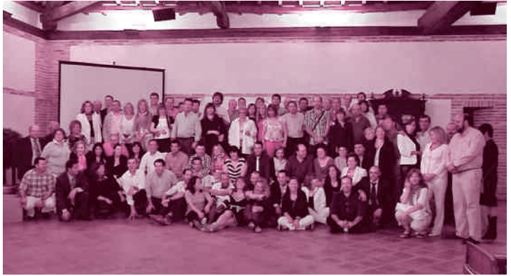
Foto de grupo en la última Convención de Abrasador

valor de acción y donde finalmente el trabajo en equipo motiva a trabajar día a día tratando de hacerlo cada vez mejor a fin de que el sueño de Abrasador sea una realidad permanente.